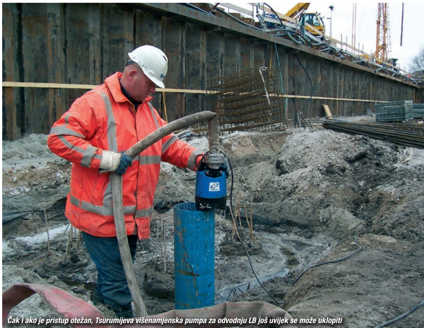
Čak i ako je pristup otežan, Tsurumijeva višenamjenska pumpa za odvodnju LB još uvijek se može uklopiti

S više od 700 modela pumpi, Tsurumi prodajni asortiman pruža sve što vam je potrebno