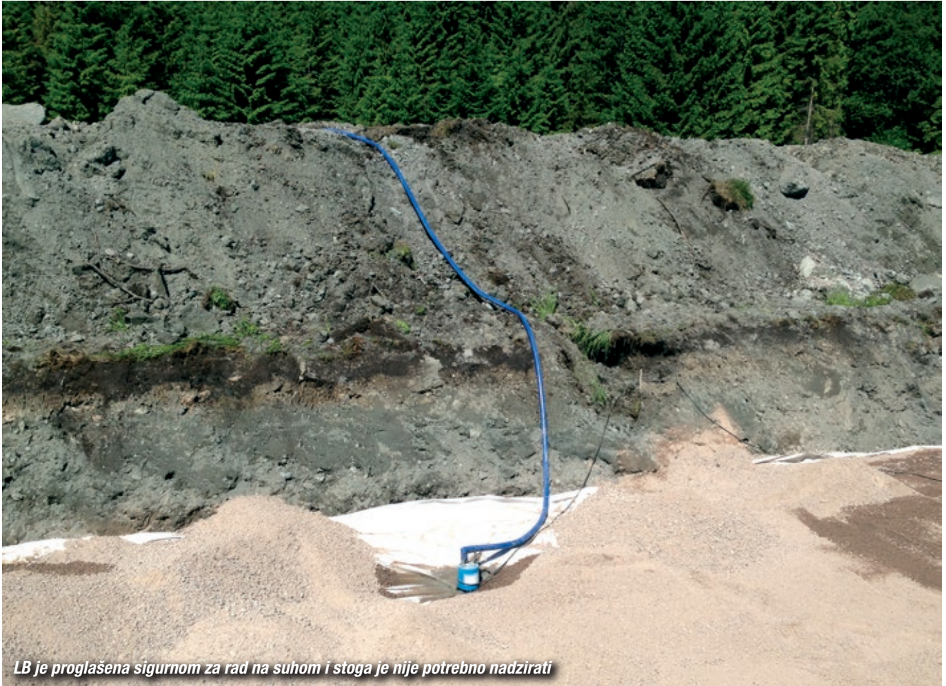
LB je proglašena sigurnom za rad na suhom i stoga je nije potrebno nadzirati

G enesis grupa d.o.o. od 2021. godine ovlašten je zastupnik za Tsurumi potopne pumpe, koji je kao vodeći proizvođač prisutan diljem Europe. Dizajn i visokokvalitetni proizvodi za teške uvjete u različitim primjenama za drenažu vode uključujući rudarstvo, izgradnju tunela, građevinarstvo i industriju, omogućavaju najbolju uslugu u klasi za svoje klijente proizvodima koji se lako održavaju i koji smanjuju troškove za korisnike. Kao pouzdani partner, Tsurumi kontinuirano radi na novim inovativnim rješenjima za potrebe klijenata, istražujući nove primjene i tržišta.