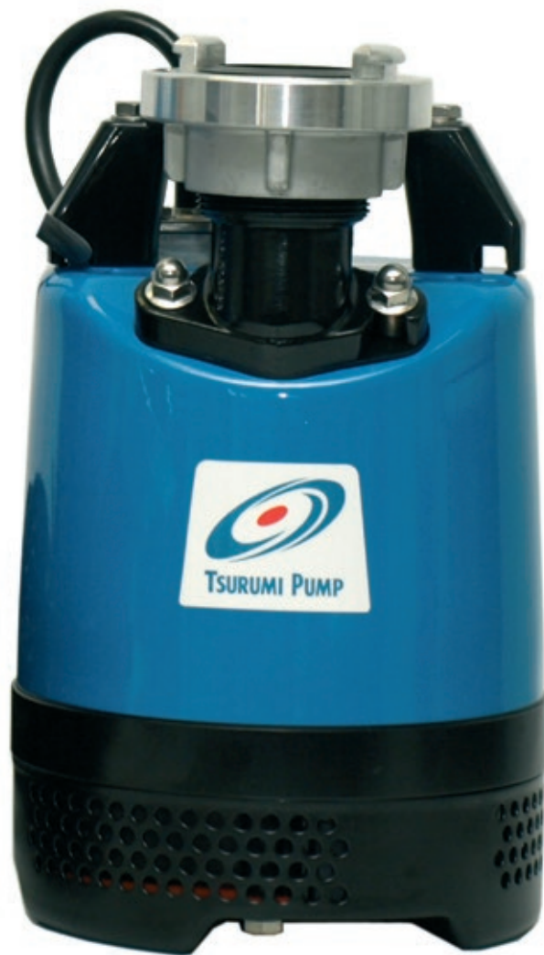
Pumpa dolazi s 2-inčnim priključkom za pražnjenje na vrhu

Zona malog gospodarstva Kraljevci 13 31550 Valpovo Tel: +385 (0)31 654 777 Fax: +385 (0)31 654 779 E-mail: info@genesis-grupa.hr www.genesisgrupa.com