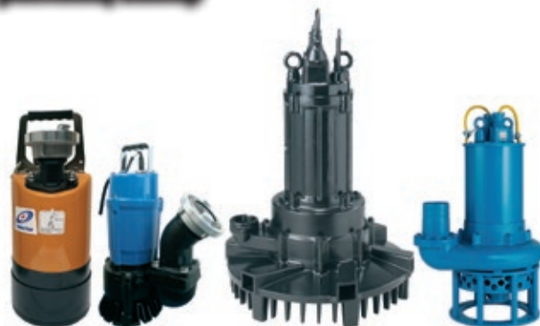
Jedan model nije dovoljan – proizvođač pumpi Tsurumi predstavlja četiri nove pumpe vrhunske klase

Stručnost u proizvodnji pumpi koja datira iz 1924. godine – danas se Tsurumi smatra globalnim liderom potopnih pumpi u građevinskoj industriji